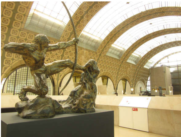
Une statue du Musée d'Orsay, le toit et sa verrière.

Ce musée m'a beaucoup plu, ces voûtes magnifiques et sa gigantesque verrière laissant passer la lumière du jour par le toit du bâtiment m'ont comblé : un endroit parfait pour prendre de belles photographies architecturales ! Le musée était grand et il contenait de nombreuses sortes de salles, l'une d'elle m'ayant particulièrement plu : La salle de l'horloge, un cadran constitué de verre laissant rentrer la lumière du jour et contrastait avec la salle sombre dans laquelle elle était.