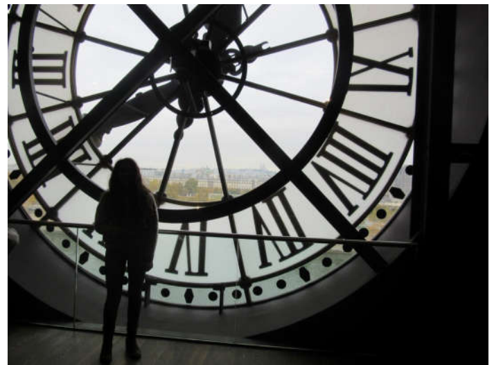
La salle de l'horloge

Par la suite, après un autre trajet en métro, nous nous retrouvons devant Le Musée national d'art moderne à Beaubourg : le centre Georges Pompidou . Un musée d'art moderne bien connu pour ses escalators en extérieur, dans des tubes transparents.