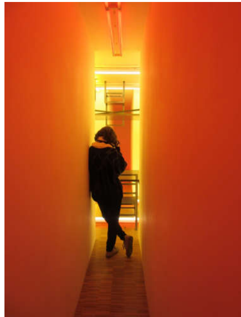
La salle néon

Une fois le musée quitté, vient le temps du repas. Nous sommes allés manger dans un restaurant qui servait sa spécialité de steaks de boeuf, un délice peu coûteux. Nous en avons profité pour aller observer une violoniste qui faisait un spectacle de rue en reprenant diverses chansons connues. Aussi, nous sommes allés faire un tour dans le centre commercial Porte-Lescot des Halles.