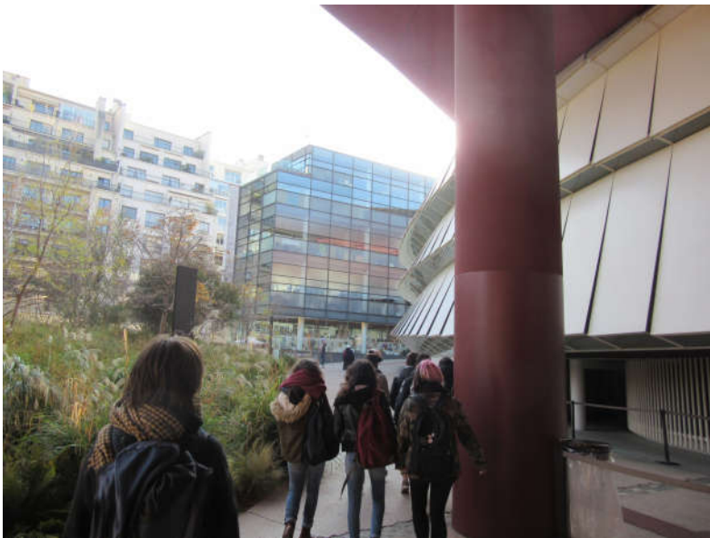
L'extérieur et jardins du Musée Branly

Ce musée est inauguré en 2006, construit par Jean Nouvel, proposant une architecture des plus originales et modernes. Je fus directement fasciné par cette grande muraille en verre et son jardin luxuriant. L'intérieur de ce musée était des plus étranges, des chemins, des rampes, une texture et une forme presque vivante des murs. Ce musée était certainement mon préféré parmi ceux que nous sommes allés voir. Son aura mystérieuse et ces masques tribaux et effrayants m'ont tout de suite passionné.