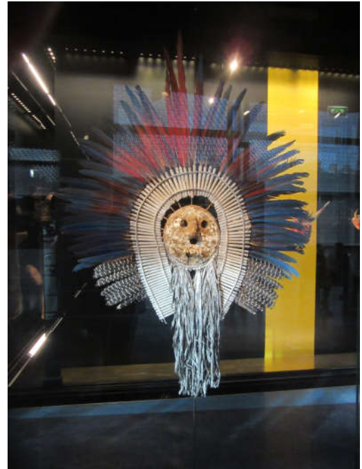
Un des masques Tribaux

Ensuite, après la visite de ce mystérieux endroit, nous avons pris la direction du plus célèbre monument de Paris : La Tour Eiffel , édifée en 1889 par Gustave Eiffel, bâtiment devenu le symbole de Paris.