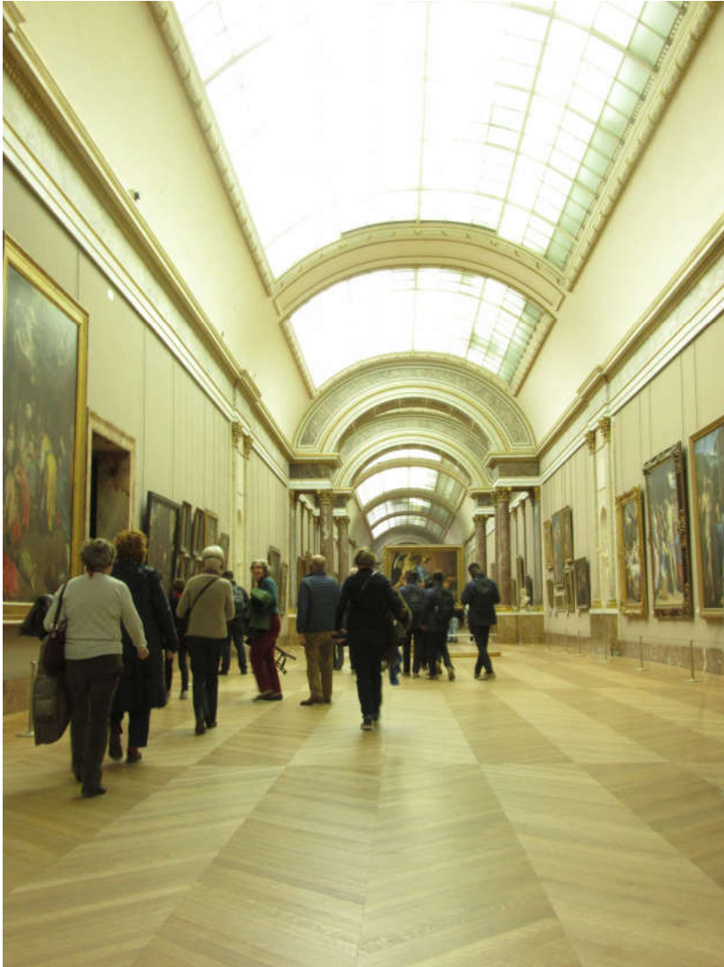
Un des couloirs principaux du Louvre

Troisième jour, dernier jour. Tout le monde est fatigué mais motivé pour aller visiter le musée le plus connu et le plus grand de Paris : Le Louvre . J'étais déjà allé au Louvre il y a quelques années. Déjà j'étais impressionné par la taille de ce musée. En deux heures nous n'avons pas vraiment eu le temps de tout visiter mais cela était suffisant pour prendre quelques bonnes photos.